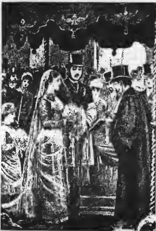
O casamento de Leopoldo Rotschild na Sinagoga Central de Londres — Gravura do "Crapavillot" de Paris, nº especial de setembro de 1936. O dote dos noivos foram títulos da Colônia do Brasil...

os Muckers mandaram uma representação hipócrita ao Governo Imperial. Queixavam-se de perseguições policiais injustas contra os moradores das colônias alemãs, promovidas por desordeiros e intrigantes. Eram uns cordelinhos inocentes, contra quem as autoridades se haviam desmandado em Insultos, violências e prisões. Exa-